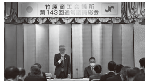
当初予算説明会の様子