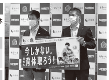
広島県とサンフレッチェ広島との連携協定式(令和3年11月)

育児取得中、仕事が円滑に進むか不安な面もありましたが、結果的にはフォローしたメンバーの力量の底上げやチームワークの向上に繋がりました