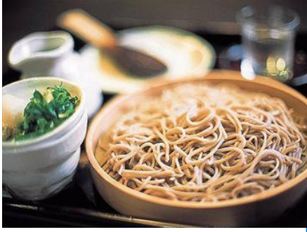
雰囲気のある蔵の中で手打ちそばを

竹原商工会議所では、地元の産業を知って頂くために、日頃なかなか見ることのできない竹原市内の工場や各種施設の見学会を行っています。今回は、アヲハタ ジャムデッキにて2月限定の洋酒入りジャムづくり体験をして頂き、藤井酒造(株)にて今が旬の清酒の製造現場を体験いただきます。この機会にぜひご参加ください。