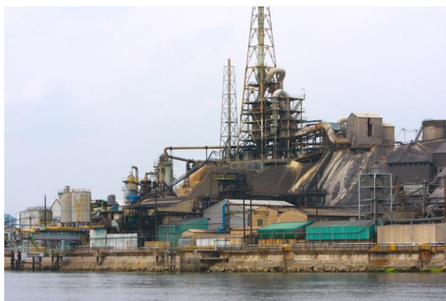
生きている軍艦島 契島

※30名様以上の団体様10%割引有（税込） ※旅行会社様向け手数料ございます。（団体割引との併用はできません。） ※左記日程以外にも貸切船のご用意などございます。ご相談下さいませ。