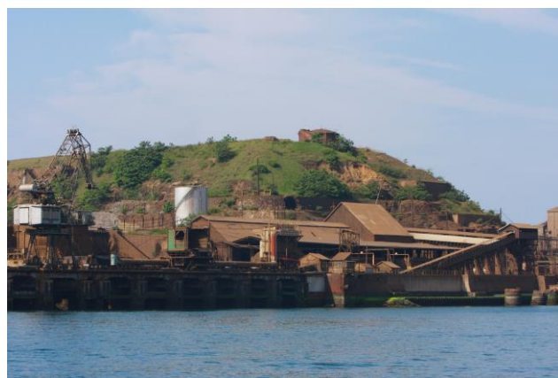
四阪島（しさかじま）