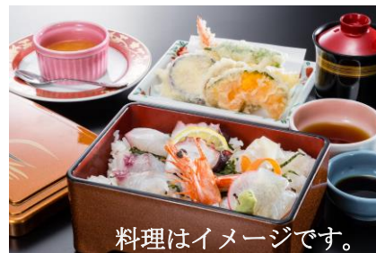
料理はイメージです。